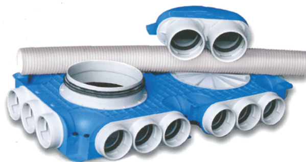
Nominale afmetingen luchtslang