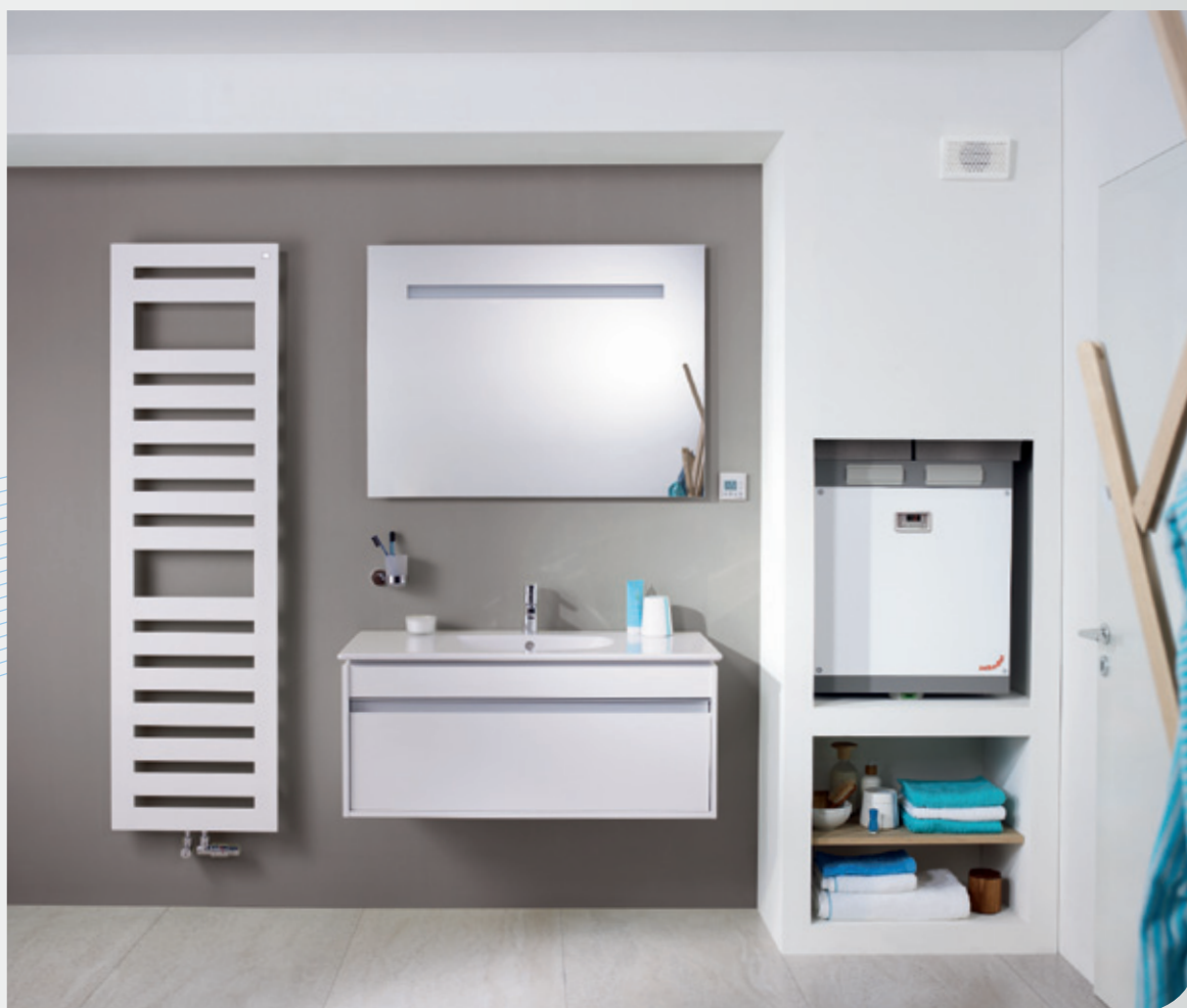
Inbouwoplossing voor de badkamer - gesloten

Wanneer de indeling van een woning geen beperkingen kent, worden alle componenten buiten het zicht geïnstalleerd. Alleen de bedieningsunit en de toe- en afvoerventielen blijven zichtbaar.