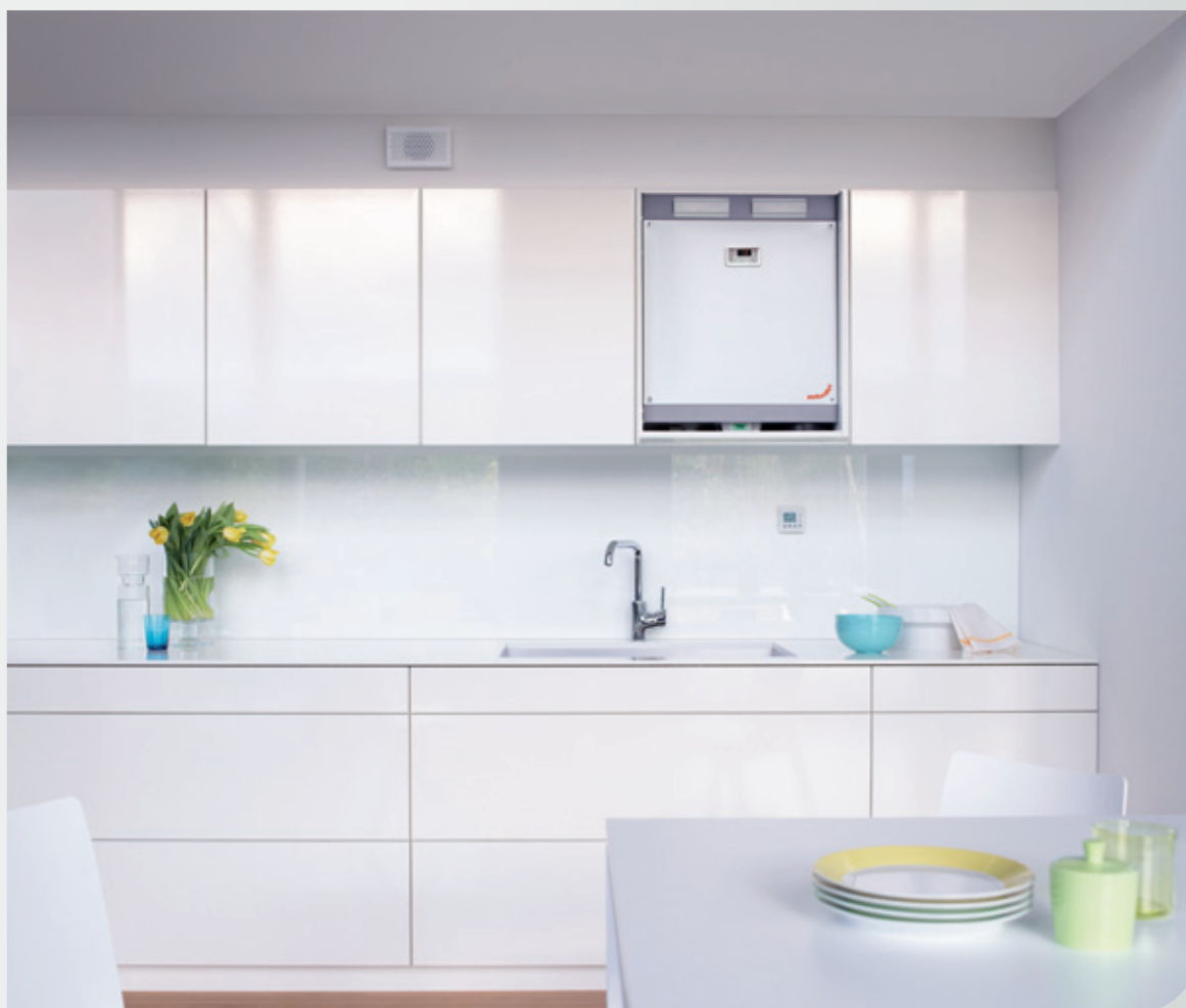
Inbouwoplossing voor de keuken - open

Door de positieve bijdrage aan de EnergielIndex blijven de waarde en verhuurbaarheid van het pand behouden.